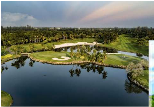
アルパインゴルフクラブ(タイ)