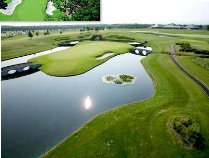
ザ・ノースカントリーゴルフクラブ