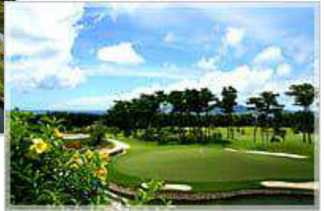
喜瀬カントリークラブ(沖縄)