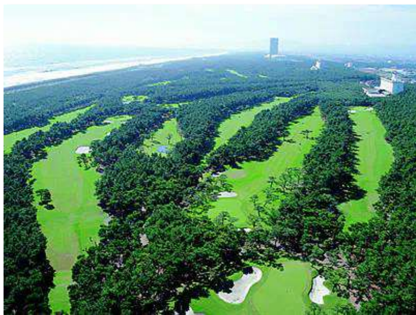
フェニックスカントリークラブ

コース設計者： 青木 功 (ツアープロシニア) ホール数： 18ホール、7,093ヤード 会員数： 756名 ※2024年4月現在 正会員及び登録会員を含む 提携コース： フェニックスカントリークラブ、トムワトソンゴルフコース(宮崎県)